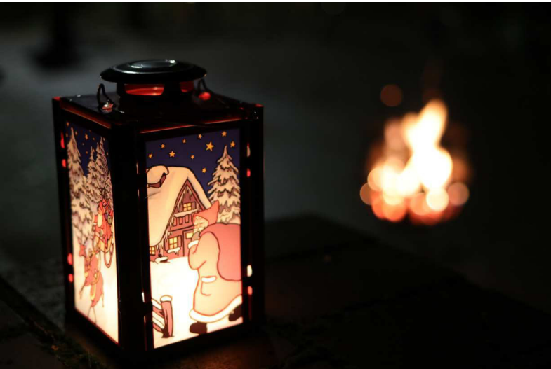
Advent unter der Laterne, Dezember 2018

► Die neuen Gemeindebriefe können von den Austrägern am Donnerstag, dem 23. Januar, von 13:00 bis 18:00 Uhr und am Freitag, dem 24. Januar, von 10:00 – 18:00 Uhr im Evangelischen Gemeindehaus abgeholt werden.